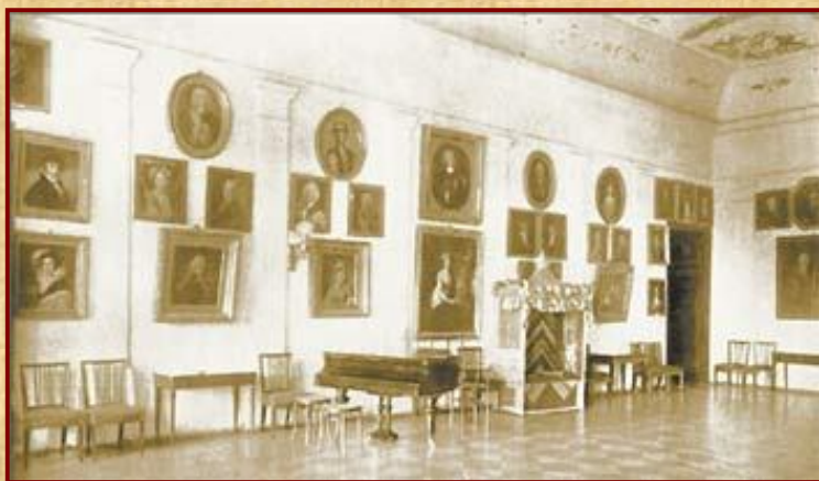
Гордость зубриловского дворца — портретная галерея. Фотография сделана до 1905 года